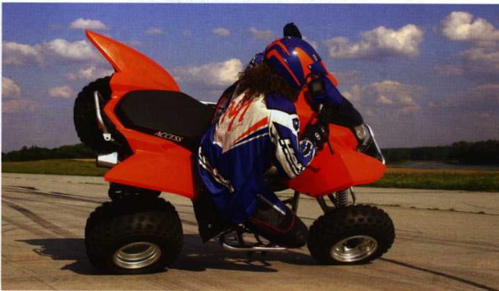
Text a foto: Přemek Vaněk.